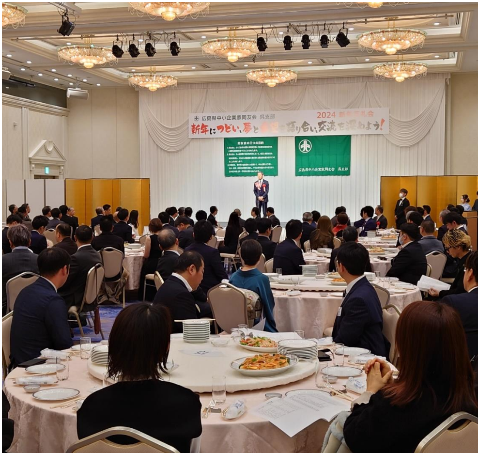
ご来賓によるご挨拶の様子