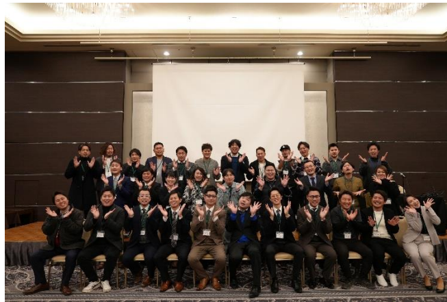
「呉森沢ホテル」にて恒例の記念写真

ていたつもりなのに、なぜ辞めたのか?何が悪かったのか?自問自答を繰り返し、まずは自分の在り方、会社の在り方であることに気が付きます。