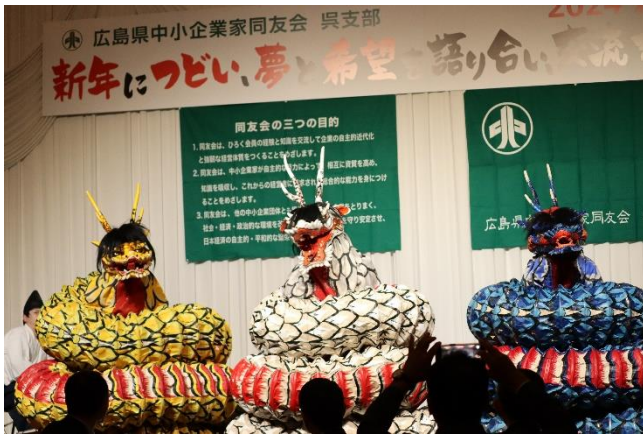
神楽団による華麗な龍の舞