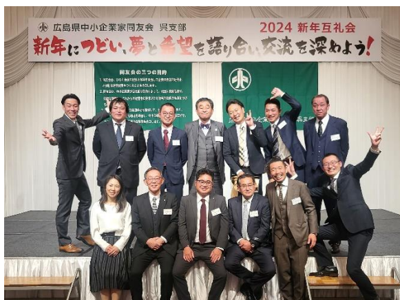
広西メンバーで記念写真

よって崩れ去り、当たり前前にあったものが当たり前ではなくなつた瞬間でした。我々も今ある現状が当たり前にあるものではなく、日々感謝しなければなりません。いつ起こりうるかわからない災害に対してBCP(事業継続計画)の策定が必要だと感じます。私自身、色々と考えさせられた新年互礼会でした。