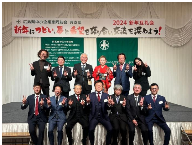
広北メンバーで記念写真

また、個人的には新会員として壇上で紹介していただき、多くの方とはじめましてのご挨拶をさせていただきます。これから同友会の参加を通して学びと繋がりを増やしていきます。