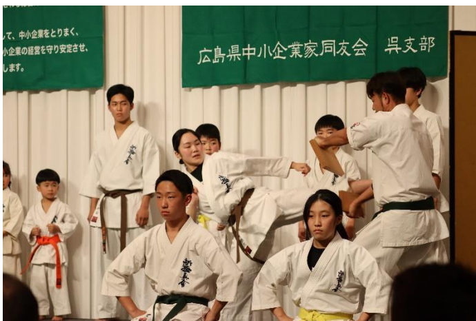
力強い演武の様子

新年互礼会終了後は、音戸倉橋地 区会のメンバーで二次会を行いました。 21時に入店しましたが思いの