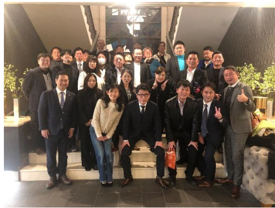
「吳森沢ホテル」にて恒例の記念写真

次第に同友会の話から、お互いに興味がある内容となり、各テーブル大変盛り上がっている印象を受けました。