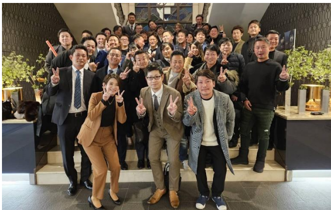
「呉森沢ホテル」にて恒例の記念写真