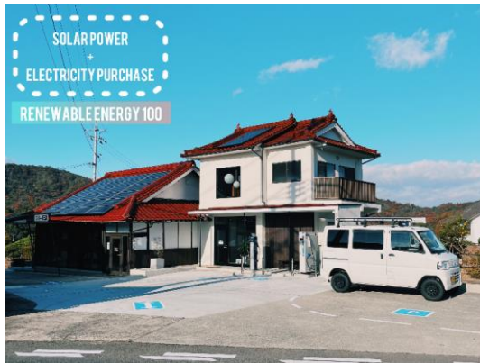
電操シェアの外観

さらに、災害時には地域の防災拠点として利用可能で、太陽光発電+蓄電池+EVで、停電時でも施設に電力を供給できます。