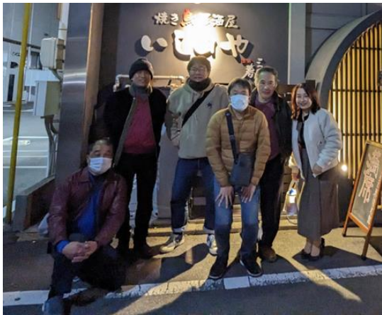
「いし田や」の前で久々の記念写真

昭和地区12月例会は「いし田や」にて参加6名で忘年会を開催し、それぞれこの一年を振り返る会となりました。