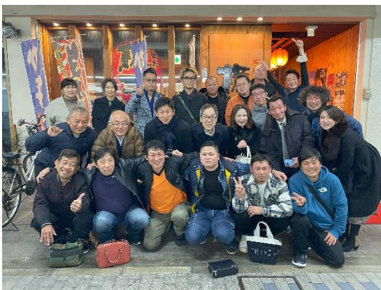
「権三」の前で恒例の記念写真

コロナ禍の規制が全面的に解除されてからの忘年会となりましたが、やつと通常に開催でき大変楽しい時間を過ごすことができました。一年間ありがとうございました。