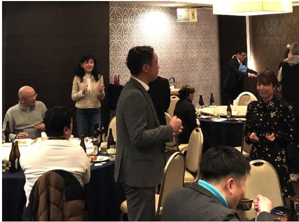
各テーブルで交流も進みました

2023年最後となる12月吳南地区会例会は、「大忘年会」と題し、恒例の忘年会を開催しました。