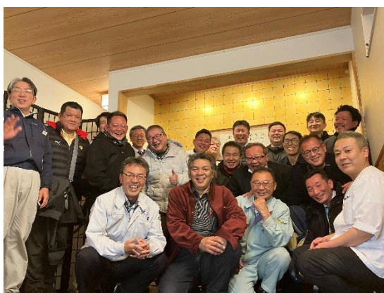
「藤田屋」の前で記念写真

令和5年は、ほぼ全ての行事が通常開催出来るようになり、今回のような懇親会も行ってきました。やはり勉強会だけではなく、その後の懇親会も大切だと改めて感じました。