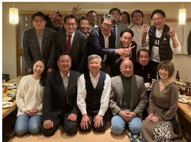
今年も広西メンバーと一緒に良い年を過ごすぞ!

原会長から毎年恒例の「広西最高!!」という言葉もでており、盛り上がりも最高潮といった様子でした。来年も、この最高の広西のメンバーと共に経営だけでなく人生について勉強させていただきたいと思っています。