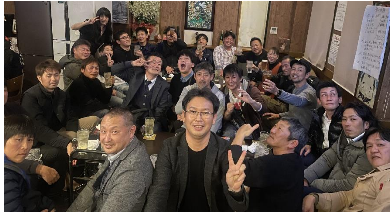
お店からあふれんばかりの広東メンバー

スになる学びと、切磋琢磨できる仲間を見つけたことが同友会活動において重要だと改めて感じました。