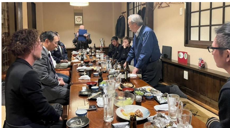
一言スピーチの様子