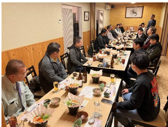
懇親会開会前の様子