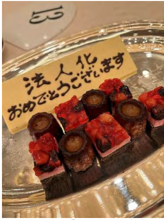
みなさんに「シェア」します

今回は、法人化の承認総会ということで、懇親会のデザートに「法人化おめでとうございます」と書かれたチョコプレートが出されました。