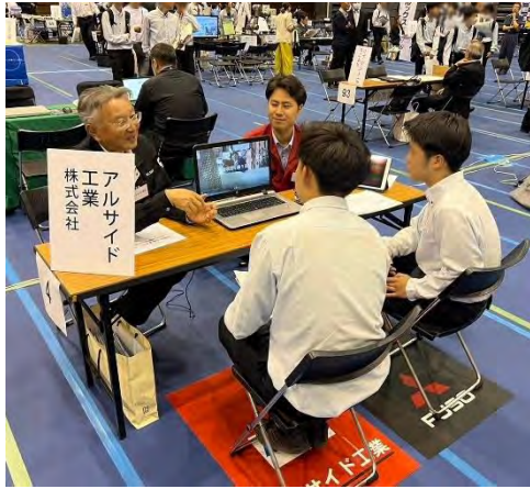
アルサイド工業(株)のブースの様子

広西地区会の5月例会は、「高校生と保護者のための企業ガイダンス」に参加しました。