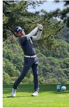
中里支部長による始球式

また、広島中支部からも4名ご参加いただき、チャリティーゴルフ大会を大いに盛り上げていただきました。