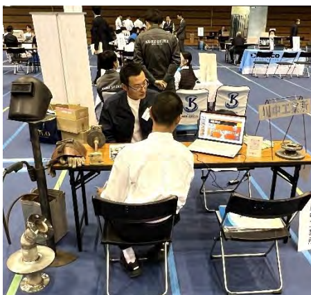
(有)川中工業所のブースの様子

企業側からも着席数が増えたとの声が聞けたので、この取り組みは成功だったのではないのでしょうか。次回は広報として、高校生にインタビューをして生の声を聴いてみるのも面白いのではないかと思います。