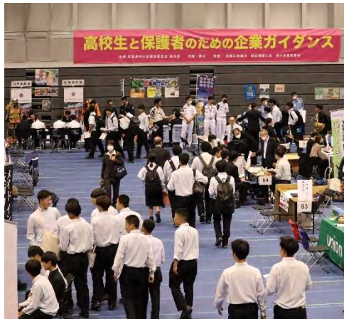
たくさんの生徒さんに来場して頂きました

学校側では、1年生から3年生の全生徒を学校行事として参加したり、1年生、2年生が地元の中小企業を知る総合学習の一環として参加する、という取り組みの学校もあ