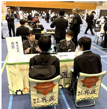
ブースの展示にも工夫(株 呉匠)

いきやすいのでは」という声も聞かれました。この点で、このガイダンスに社員さんをいかに巻き込んでいくかも今後の課題の一つです。次に、出展会員企業の感想をご紹介します。