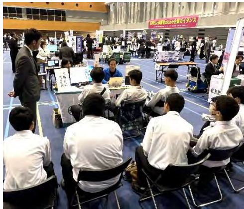
熱心に説明を聞く生徒さん

んと話す機会というのは、そうありません。今の高校生、そしてその親御さんが、中小企業に対してどう感じているのか。弊社のようなニッチな業種に対して、どう興味を持ってもらえるか。それを生の声で聴けた大変有意義な一日でした。 それとは別で、他の会員様のブースなどを見ていると、色んな工夫がされているので刺激になりました。この規模での開催は大変貴重な事なので、これからも続けていきたいと思っております。そして、呉には色んな会社があることを学生の皆様知って頂いて、これからの呉を一緒に盛り上げていきたいと思