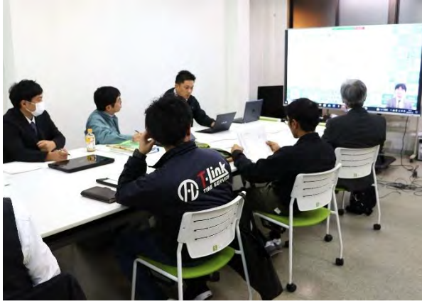
途中参加もOKです(写真は昨年度の様子)

昨年に引き続き、経営基礎講座がスタートしました。第1回目の今回は「経営理念編①」。