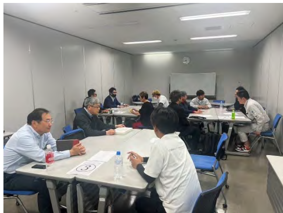
グループ討論の様子

各グループ長の進行のもと特に悩み、課題、価値観やビジョンについての討論が多かったように感じます。