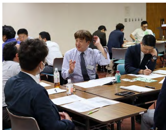
グループ討論の様子

した12年前の弱みの部分が現在では強みとなり、着実に自社を変革と成長しつつある体制へ変えられていました。