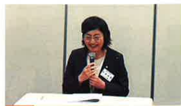
会場 ひと・まちプラザ 33名 (内オプ1名)