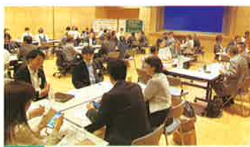
会場 ひと・まちプラザ 60名