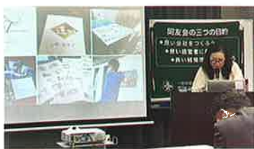
会場 ひと・まちプラザ 14名