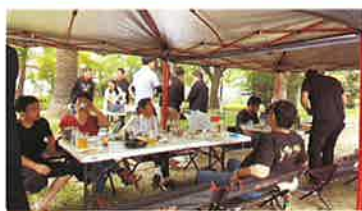
会場 千田町公園 17名