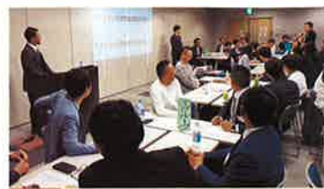
会場 ひと・まちプラザ 52名