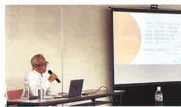
会場 佐伯区民文化センター 26名