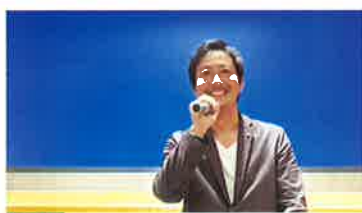
会場 ひと・まちプラザ 60名