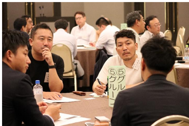
グループ討論の様子