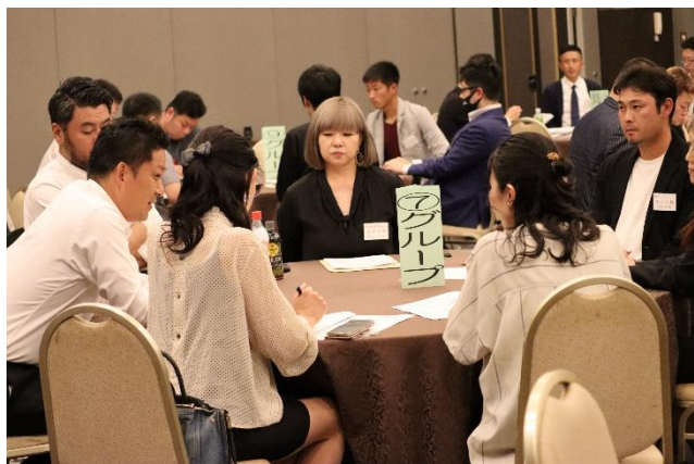
グループ討論の様子

私自身、今年で同友会に入会させていただいて、10年になります。自分一人では経験できないことさせていだいたり、みなさんから知恵をお借りしたりしています。 これからも継続して、私にとって、とてもありがたい場所である中小企業家同友会を、周りの経営者の方におススメしていきたいと思